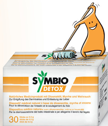
Medizinprodukt zum Einnehmen

Hinweis: Mind. 2h vor oder nach anderen Präparaten oder Arzneimitteln einnehmen.